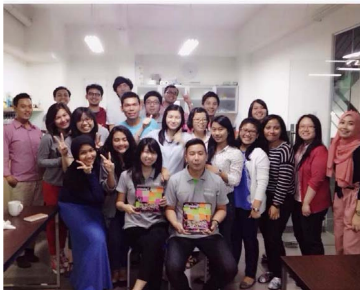
Kebersamaan karyawan PT. Tokopedia

Penulis saat menelpon media untuk media gathering dan melakukan media monitoring online .