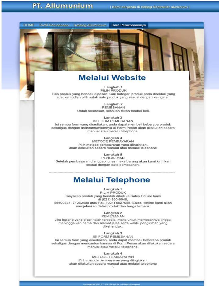
Lampiran 3. Tampilan cara pemesanan pada PT. Alluminium

Halaman Costumer Interface ini yang terdapat pada halaman Pemesanan Alluminium meliputi Context dan Content .