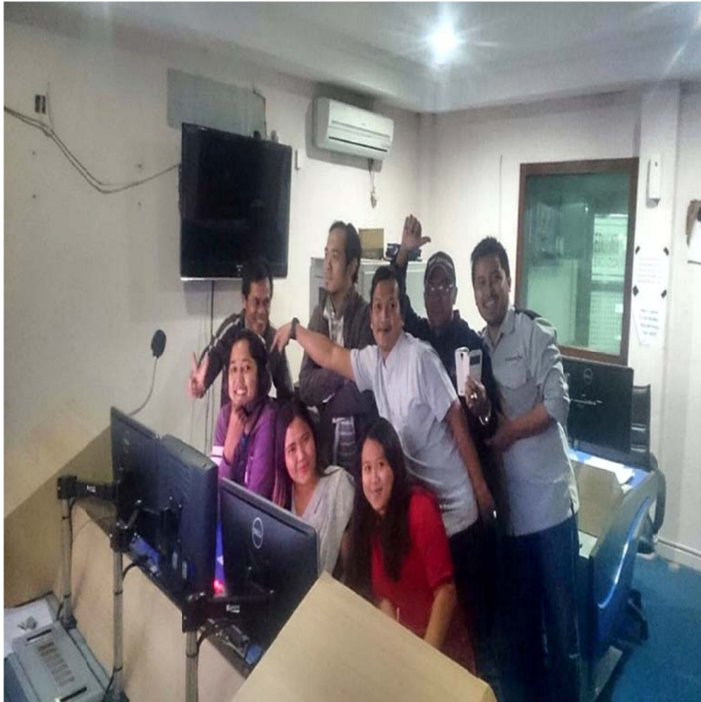
Penulis Berfoto Bersama dengan Staff MCR