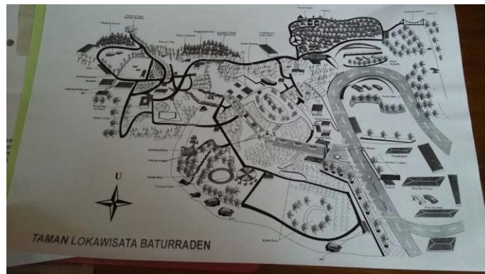
Gambar 7 : Peta Wisata Lokawisata Baturraden