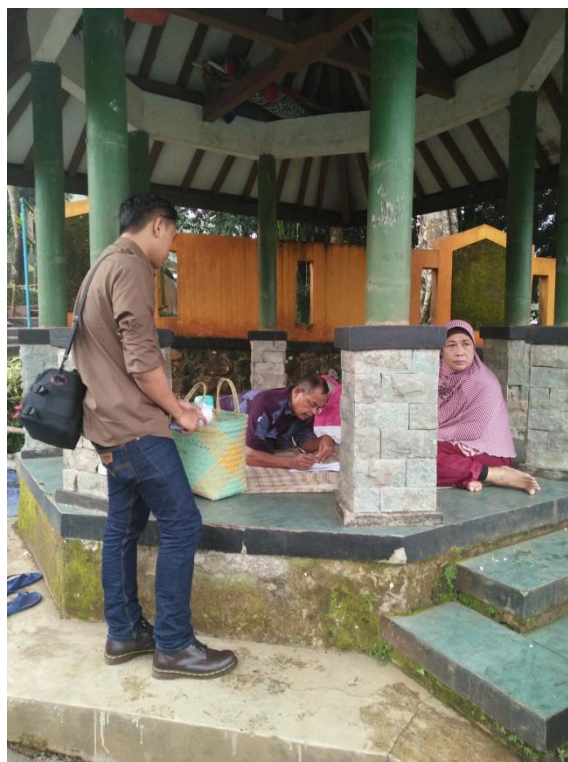
Gambar 4 : Dokumentasi dengan Wisatawan Lokawisata Baturraden