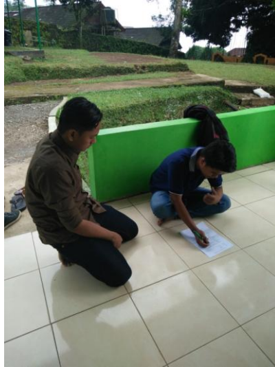
Gambar 5 : Dokumentasi dengan Wisatawan Lokawisata Baturraden