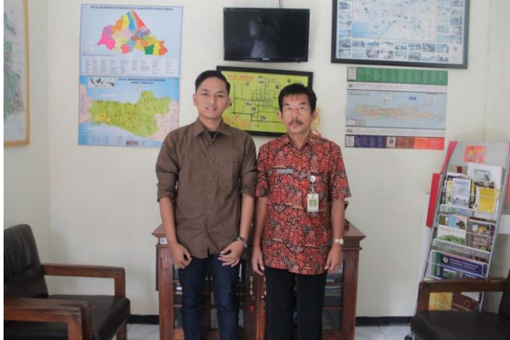
Gambar 1 : Dokumentasi dengan Kepala UPT Lokawisata Baturraden