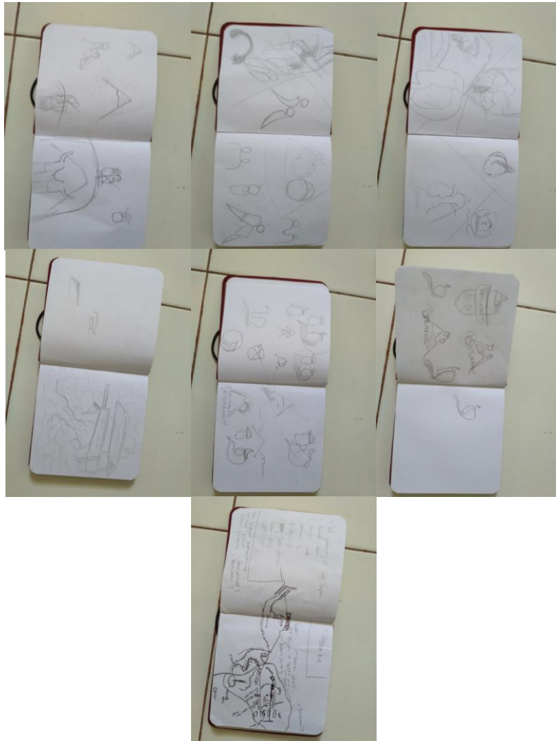
Gambar 9 : Sketsa Desain