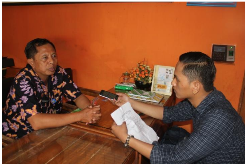
Gambar 2 : Dokumentasi dengan Staff Lokawisata Baturraden