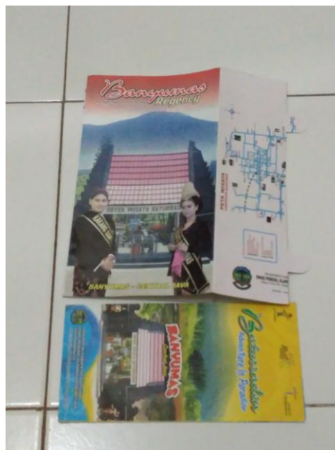
Gambar 6: Media Komunikasi Visual Lokawisata Baturraden