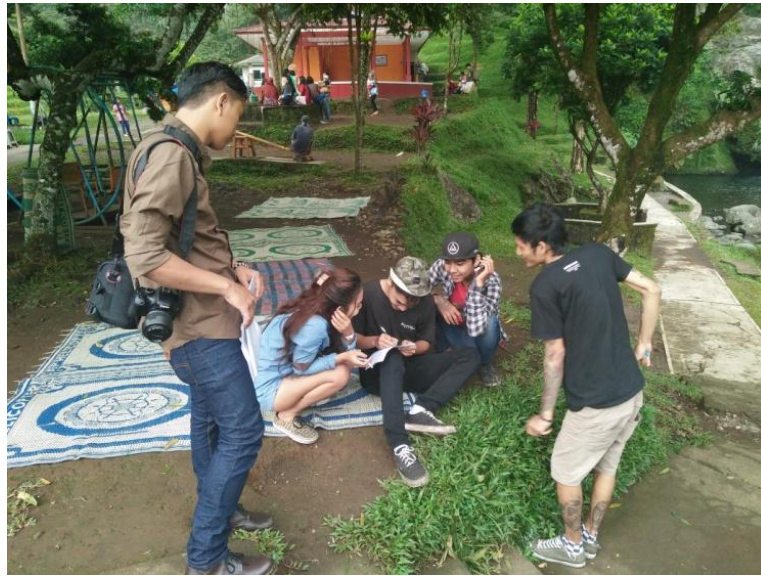
Gambar 3 : Dokumentasi dengan Wisatawan Lokawisata Baturraden