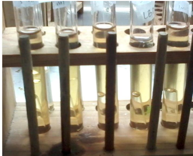
Gambar 12 setelah 24 jam