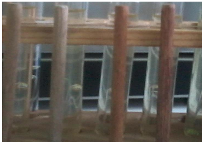
Gambar 13 setelah 48 jam