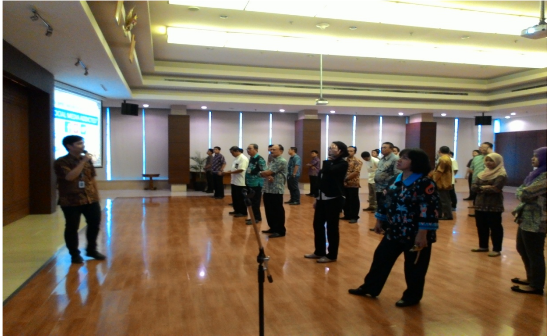
Materi yang dibawakan oleh Departemen SHE sebelum dilaksanakan Senam WIKA bersama