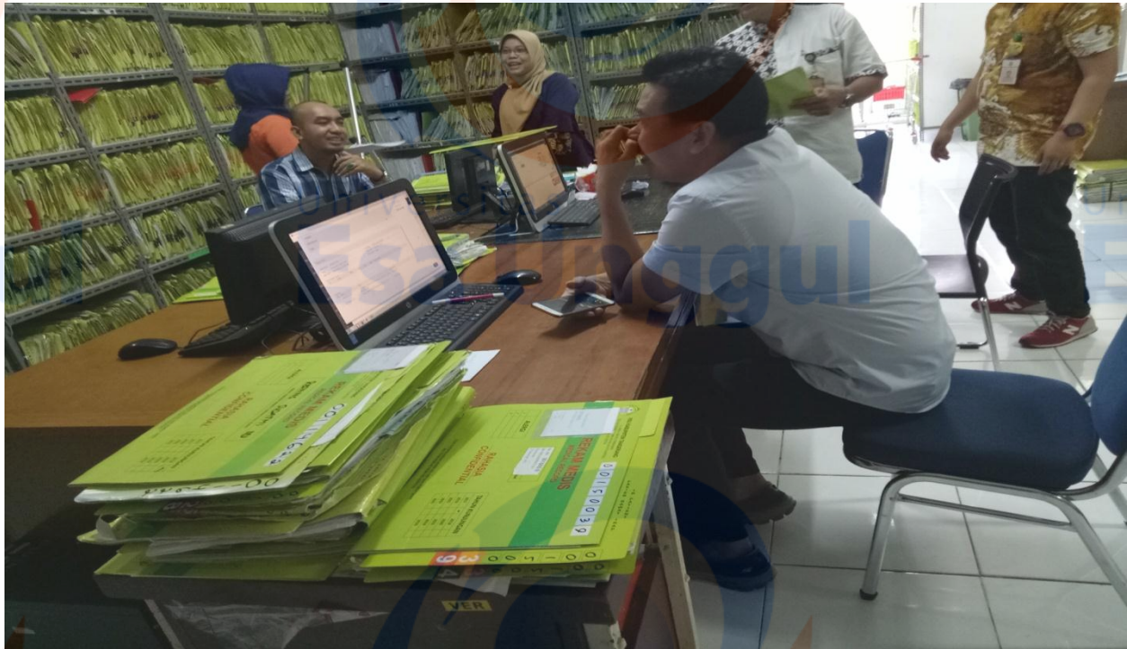
Foto Ruang Pendaftaran Rawat Jalan