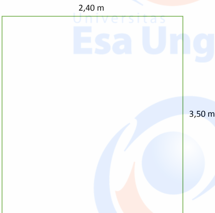
Tata letak Rak penyimpanan A