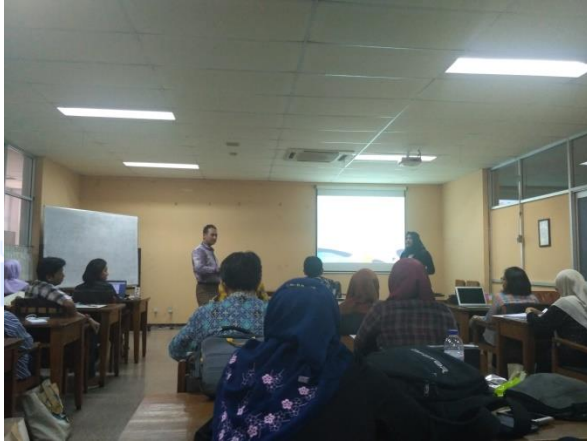
Gambar 27. Penyampaian Materi 3