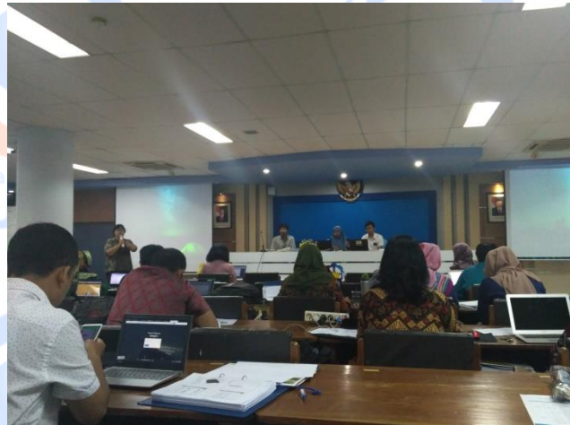
Gambar 2. Pembukaan dan Sambutan oleh Direktur International Office ITS