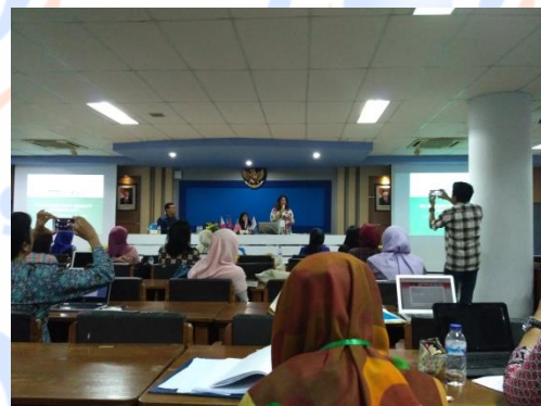
Gambar 22. Presentasi oleh St. La Salle