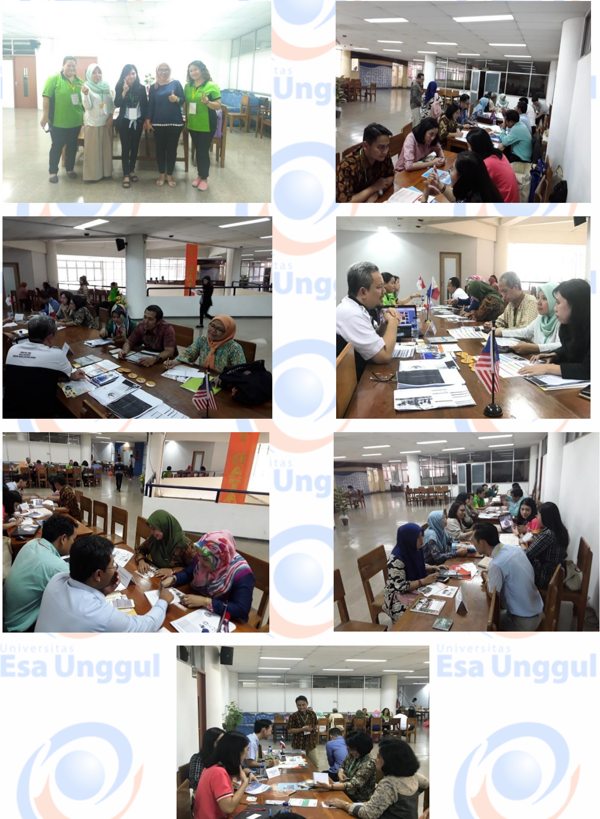
Gambar 16. Dokumentasi foto kegiatan International Staff Day

dari kelima universitas luar tersebut untuk melihat adanya kemungkinan kerjasama lebih lanjut bagi kampus mereka masing – masing (Gambar 15).