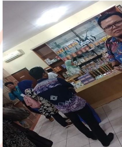
Gambar 19. Situasi di UKM (SME Visit)