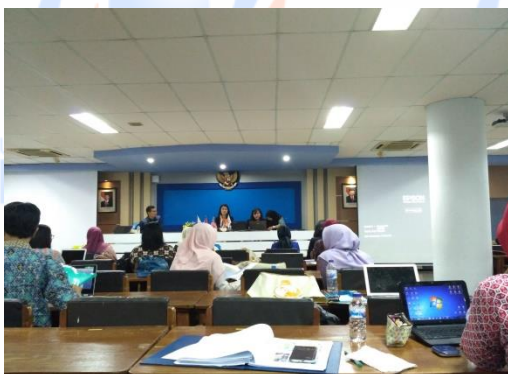
Gambar 21. Presentasi oleh KMNU

Materi ini dimulai pukul 08.00 wib sampai dengan pukul 11.30 wib. Sesi ini dibawakan oleh Direktur International Office ITS Surabaya. Sesi ini membahas tentang program – program internasional yang dilakukan oleh ITS Surabaya dalam mengembangkan potensi dan sumber daya para staff non-akademik dari kampus ITS Surabaya. Adapun program – program yang dilakukan seperti ITS Staff Mobility, Erasmus Project, Penyediaan Text Book Bahasa Inggris, In-house Training, Inbound Staff Mobility . Pada sesi ini, semua peserta dari kelima perguruan tinggi asing yang saat ini mengikuti kegiatan Inbound Staff Mobility di ITS Surabaya yang pada hari kedua mengikuti kegiatan International Staff Day , hadir dan melakukan presentasi di depan para peserta Pelatihan Penguatan Kantor Urusan Internasional; King Mongkut North Bangkok University Thailand (KMNU), University of St. La Salle Philippines, University Kuala Lumpur Malaysia, King Mongkut's University of Technology Thonburi Thailand (KMUTT), Shibaura Institute of Technology Japan (SIT), Mean Chey University Cambodia . Mereka melakukan presentasi tentang kampus mereka masing – masing dan kesempatan kerjasama yang ditawarkan bagi institusi pendidikan luar negeri.