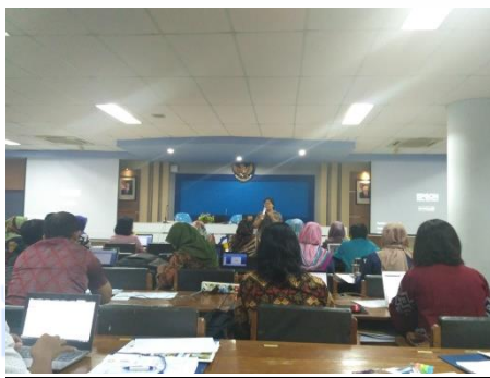
Gambar 9. Penyampaian Materi 5

Materi kelima ini dimulai pukul 15.30 wib sampai dengan 16.30 wib. Materi ini kembali dibawakan oleh Direktur International Office ITS Surabaya. Pada sesi ini membahas tentang bagaimana mencari dan membangun mitra kerjasama yang berasal dari universitas luar negeri lewat kesempatan International Education Exhibition . Pada sesi ini dijelaskan tentang pameran – pameran pendidikan internasional yang pantas kita datangi untuk promosi kampus dan mencari serta menjalin mitra kerjasama luar negeri. Adapun beberapa international exhibitions yaitu APAIE, NAFSA, EAIE, APPLE. Selain lewat international exhibitions , KEMENRSITEK DIKTI juga menyediakan program hibah PKUI yaitu upaya peningkatan kerjasama perguruan tinggi (PT) dalam negeri dengan PT luar negeri; serta hibah BFKSI yaitu hibah secara kelembagaan untuk penguatan kerjasama internasional (Gambar 9.)