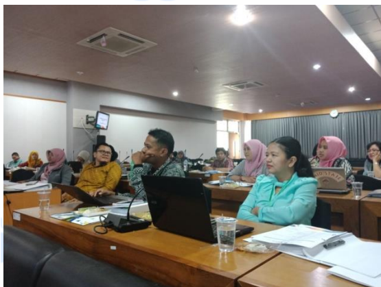
Gambar 17. Penyampaian Materi 6

Materi ini dimulai pukul 15.00 wib sampai dengan 16.30 wib. Materi ini dibawakan dan disampaikan oleh Direktur International Office ITS Surabaya. Materi ini membahas tentang bagaimana membuat dan menyelenggarakan short programs dengan baik. Adapun short program dari ITS Surabaya sendiri yang telah sangat populer yaitu CommTech Camp . Program ini dihadiri oleh lebih dari 30 negara dari seluruh dunia dan dilaksanakan dua kali dalam setahun. Dalam membuat sebuah short programs kita harus mencari keunikan dari kampus kita masing – masing yang dimiliki oleh kampus – kampus lain, harus menciptakan konsep ide yang unik dan menarik. Lalu kemudian melakukan promosi baik lewat social media maupun kerjasama dengan luar negeri dengan cara memberikan beasiswa sebagai langkah awal untuk menarik peserta (Gambar 16).