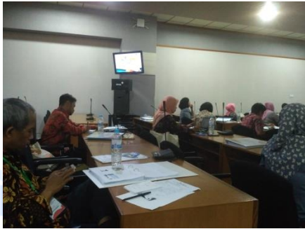
Gambar 10. Penyampaian Materi 6