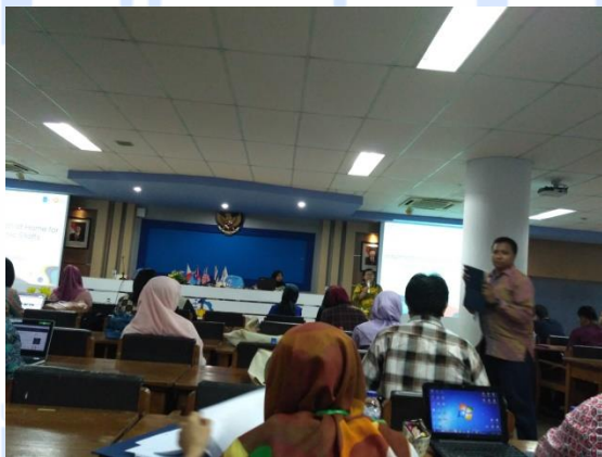
Gambar 15. Penyampaian Materi 4

Materi dimulai pada pukul 11.00 wib sampai dengan 12.30 wib. Sesi ini disampaikan oleh Direktur International Office ITS Surabaya. ITS Surabaya saat ini memiliki kurang lebih 20000 mahasiswa. Materi ini membahas tentang program – program internasional dalam pengembangan diri para mahasiswa mahasiswi ITS dalam menghadapi tantangan global. Adapun beberapa program yang dilakukan oleh International Office ITS Surabaya terkait dengan pengembangan mahasiswa mahasiswi adalah forum komunikasi internasional (workshop internship) bekerjasama dengan Badan Eksekutif Mahasiswa ataupun Himpunan Mahasiswa Jurusan, Share ITS , Student Excursion , Live Massive Online Open Course at ITS (LIMITS) . Program ini bertujuan untuk mempersiapkan mahasiswa mahasiswi ITS yang kompeten dan mampu menghadapi tantangan global dan internasional dan bermartabat di mata dunia yang merupakan salah satu harapan dari International Office ITS.