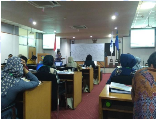
Gambar 6. Penyampaian Materi 2

Materi kedua mengenai Understanding Word Class University Ranking dimulai pukul 11.30 wib sampai dengan 12.30 wib. Sesi ini juga dibawakan oleh Direktur International Office ITS Surabaya. Pada sesi ini, para peserta diberikan pemahaman dan pengetahuan tentang system perankingan universitas kelas dunia untuk bisa diakui secara global dan terdaftar secara resmi pada situs – situs resmi perankingan internasional. Ada tiga (3) situs perankingan dunia yaitu QS Rank , Webometrics , serta ARWU (Academic Ranking of World Universities) , dan yang diakui dan digunakan oleh KEMENRISTEK DIKTI ialah QS Rank (Gambar 6).