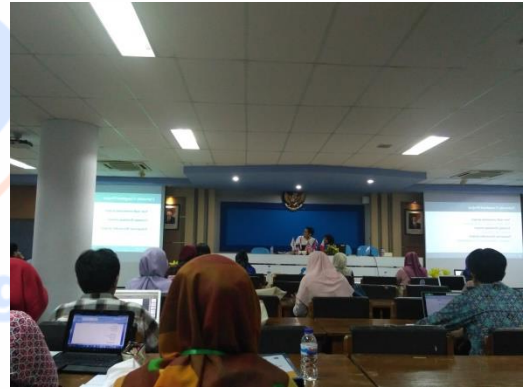
Gambar 24. Presentasi oleh SIT