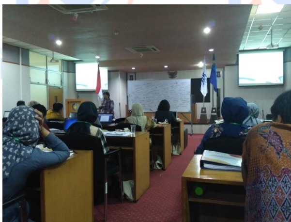
Gambar 5. Penyampaian Materi 1

Materi pertama mengenai Globalization: Challenges and Opportunities disampaikan oleh Direktur International Office ITS Surabaya. Sesi ini dimulai pada pukul 10.30 wib dan selesai pukul 11.30 wib (Gambar 5). Pada sesi ini membahas tentang bagaimana tantangan dan kendala yang dihadapi masa kini oleh perguruan tinggi – perguruan tinggi di Indonesia dalam menghadapi globalisasi dan internasionalisasi. Dimana ada yang pro dan kontra dengan internasionalisasi. Menurut Direktur International office ITS Internasionalisasi tujuannya ialah agar anak – anak Indonesia mampu belajar bahasa Inggris dalam menghadapi globalisasi dan untuk mampu bersaing dengan anak – anak asing lainnya.