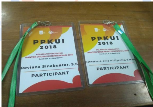
Gambar 1. Kartu Tanda Identitas Peserta PPKUI ITS 2018