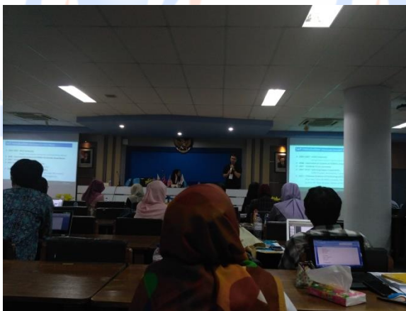
Gambar 25. Presentasi oleh KMUTTT