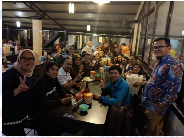
Gambar 20. Situasi Makan Malam Bersama