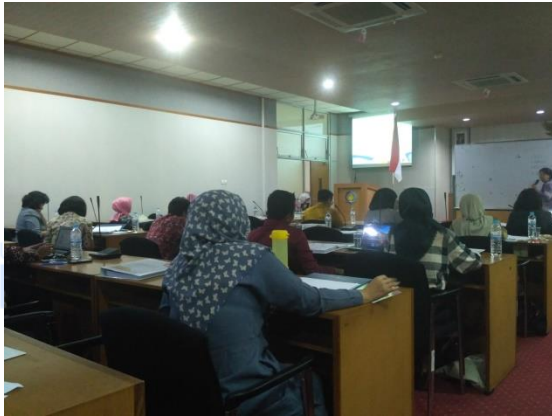
Gambar 7. Penyampaian Materi 3