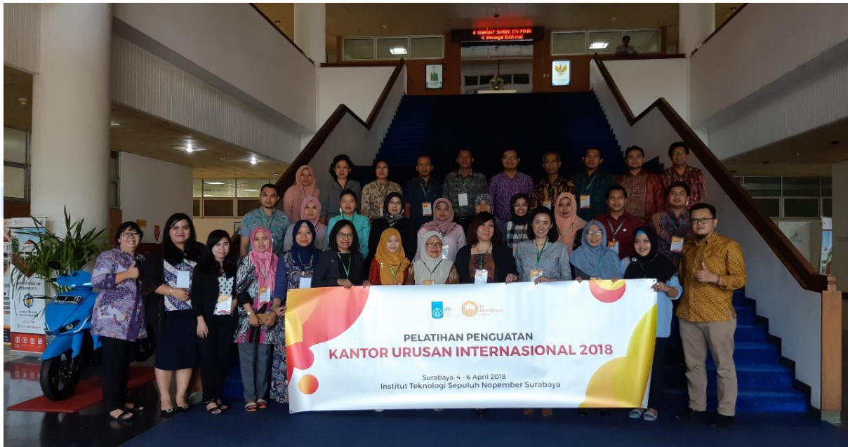
Gambar 4. Photo Session bersama seluruh Peserta PPKUI ITS 2018