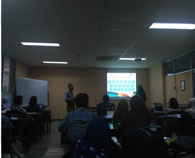
Gambar 26. Penyampaian Materi 2

Darma siswa ialah program yang dilakukan selama 1 tahun untuk belajar bahasa dan budaya Indonesia yang diadakan oleh BPKLN, KEMDIKBUD dan dikelola oleh 54 PT di Indonesia (Gambar 25).