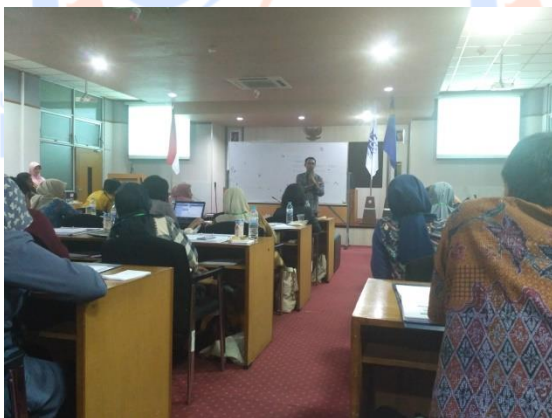
Gambar 8. Penyampaian Materi 4