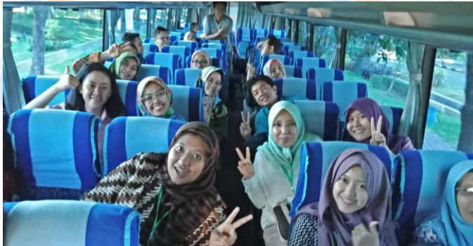
Gambar 18. Perjalanan menuju SME Visit