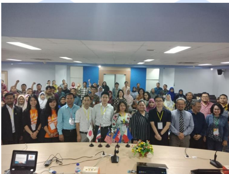
Gambar 28. Closing PKKUI ITS 2018

Sesi ini merupakan sesi terakhir dan dimulai pada pukul 16.30 wib sampai pukul 17.00 wib. Sesi ini dilakukan diskusi untuk membahas tentang action plan yaitu rencana dan target yang akan dilakukan dan diterapkan di kampus peserta masing – masing berdasarkan apa yang telah didapat dari Pelatihan Penguatan Kantor Urusan Internasional ITS Surabaya 2018 selama tiga (3) hari kegiatan ini berlangsung. Seluruh para peserta diarahkan dan diminta untuk menuliskan rencana target yang akan dilakukan di kampusnya masing – masing. Setelah diskusi tentang action plan , maka usai sudahlah acara Pelatihan Penguatan Kantor Urusan Internasional ITS Surabaya 2018 dan merupakan penutup dari kegiatan pelatihan ini.