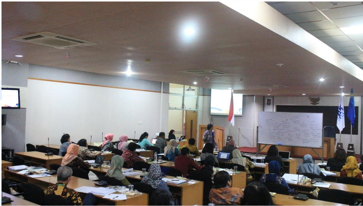
Gambar 3. Direktur International Office melakukan wrap up atas setiap kendala dan masalah Yang dihadapi oleh masing – masing peserta di kampus masing – masing