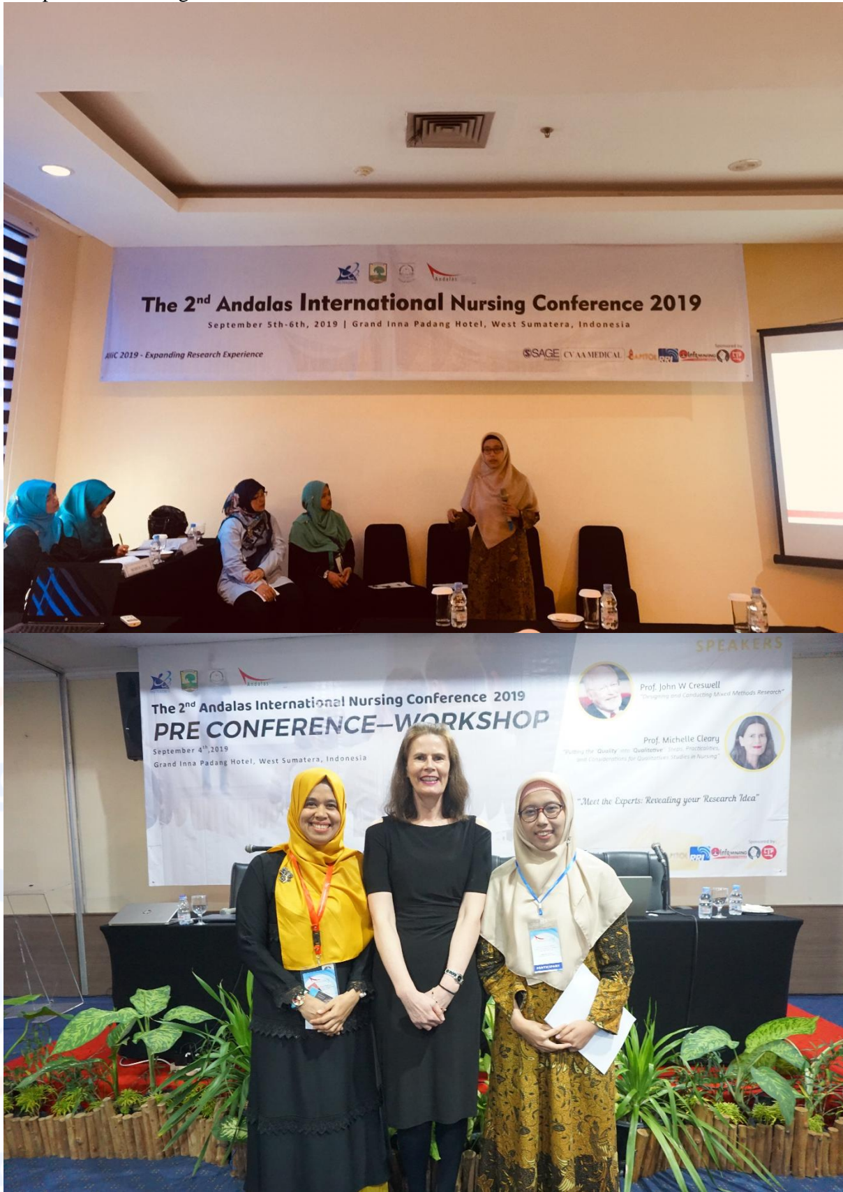
Lampiran 3. Foto kegiatan