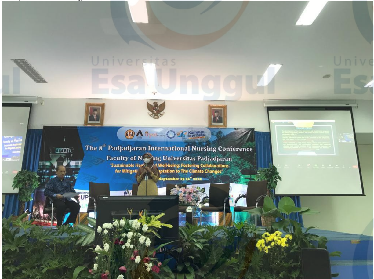
Lampiran 4. Foto kegiatan