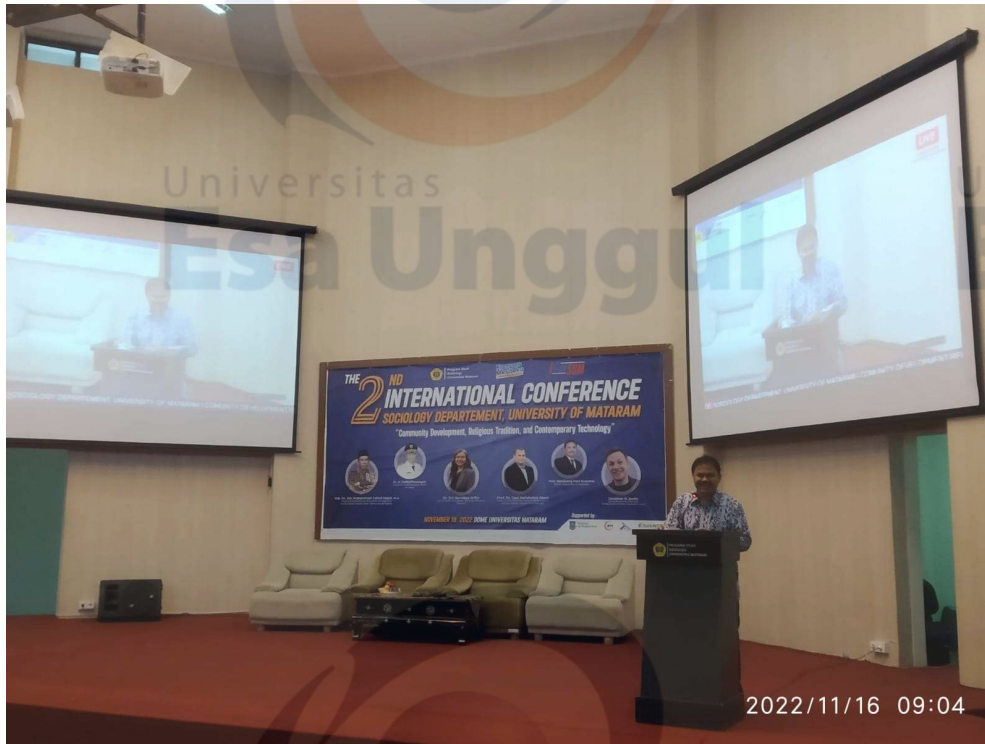
Lampiran 3. Foto kegiatan