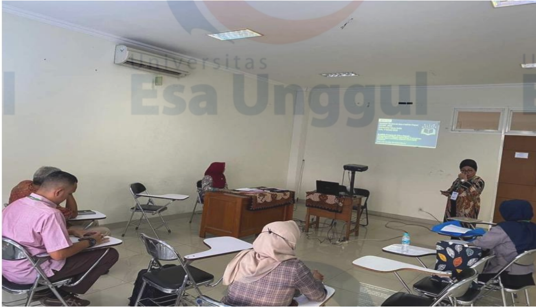
Lampiran 3 Foto kegiatan