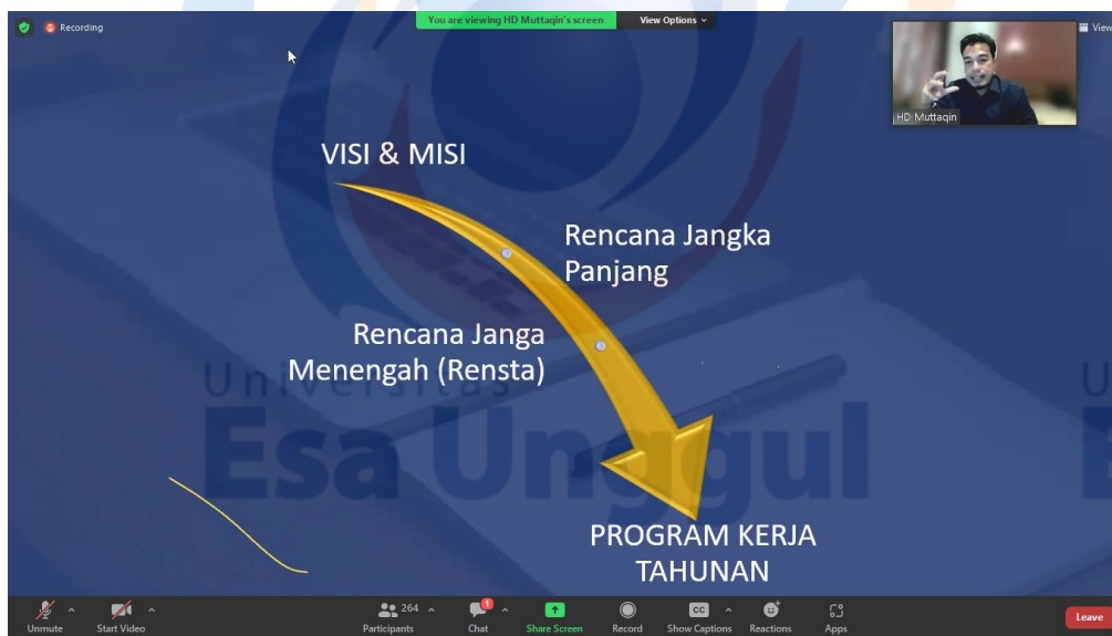
Gambar 2. Pemaparan materi