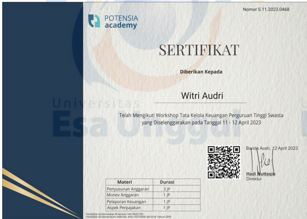
Gambar 4. Sertifikat Witri Audri