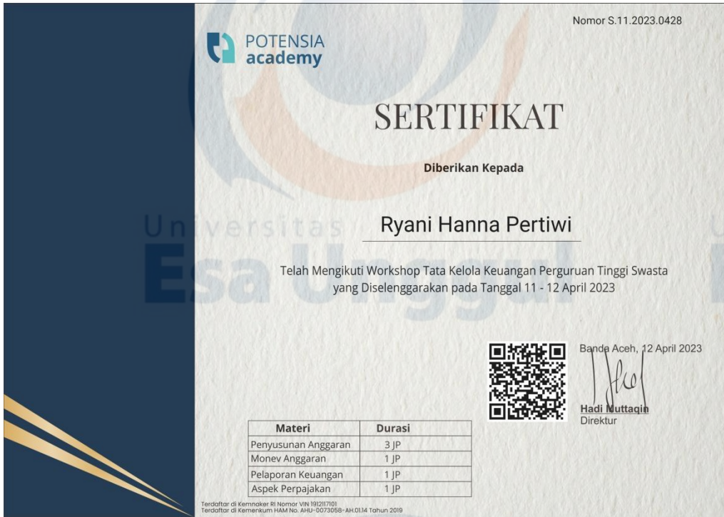
Gambar 3. Sertifikat Ryani Hanna Pertiwi