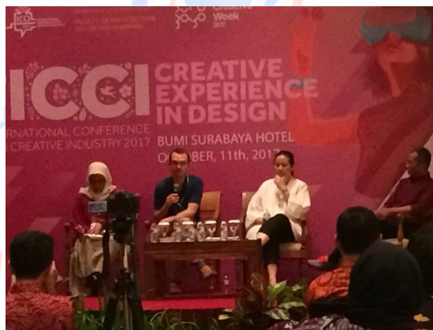
Foto 3. Keynote Speaker