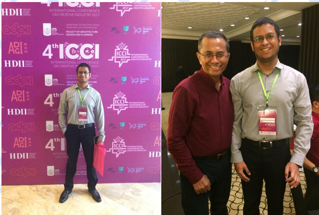
Foto 1. Photo booth dan foto dengan bpk Dahlan Iskan