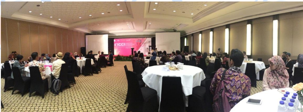
Foto 2. Kegiatan acara dimulai