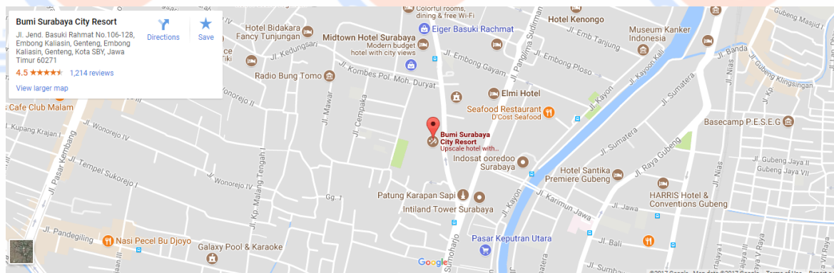
Gambar 3. Venue acara

Lokasi acara ini diselenggarakan di SURABAYA yang bertempat di ballroom HOTEL BUMI SURABAYA CITY RESORT di jalan Basuki Rahmat, Surabaya.